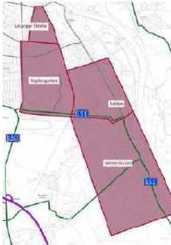
Abbildung 1 Untersuchungsgebiete